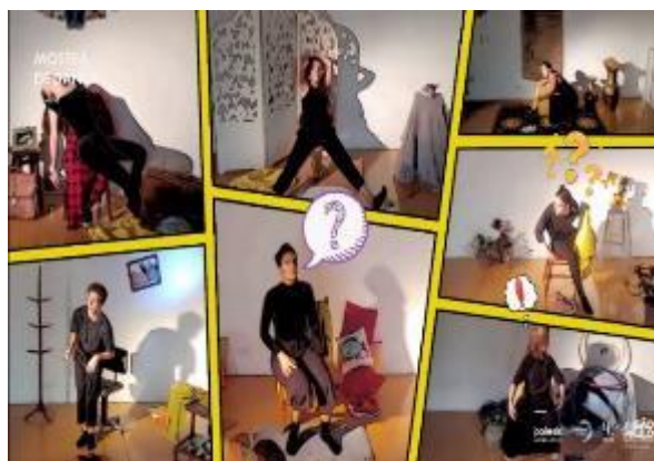
Caxola, ÔÉ de Valinhos 21/10 | Mostra de Dança

Os grupos de dança apresentaram trabalhos inspirados pelos mais diversos temas: o cárcere feminino, o manifesto corporal sobre infância e juventude preta periférica, o poema de Hilda Hilst e de Augusto de Campos, os ritmos tradicionais da cultura afro-brasileira, entre outros. Grupos que já estiveram presentes em edições anteriores foram convidados, pela equipe de curadoria, a participarem da Mostra Final: Soniquete Arte Flamenca e Cia de Dança Eclipse, ambos de Campinas, e o Harmonia Grupo de Dança, de Limeira. A programação foi transmitida no canal de Youtube das Oficinas Culturais e contou com os recursos de acessibilidade audiovisual, libras e audiodescrição, oferecendo ao público com baixa visão e\ou cego, e também com síndrome de Usher e com deficiência auditiva, o direito à informação e ao entretenimento.