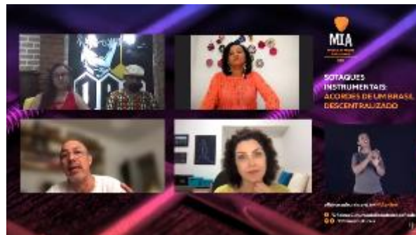
Sotaques instrumentais: acordes de um Brasil descentralizado