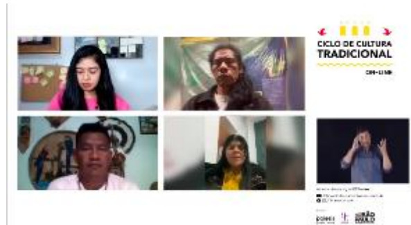
Exibição do filme "Nhemboe Porã: Belo saber" seguida de bate-papo