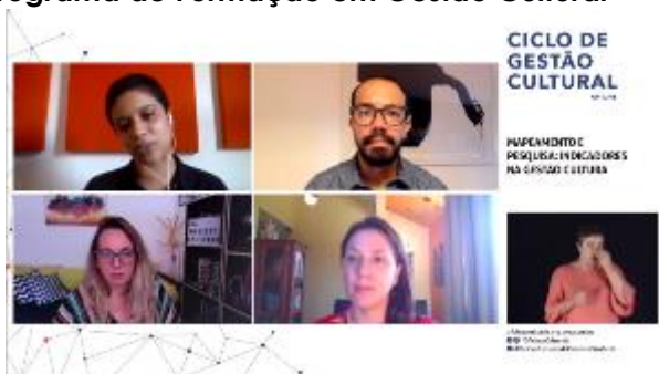
Webinar | Mapeamento e pesquisa: indicadores na gestão cultural