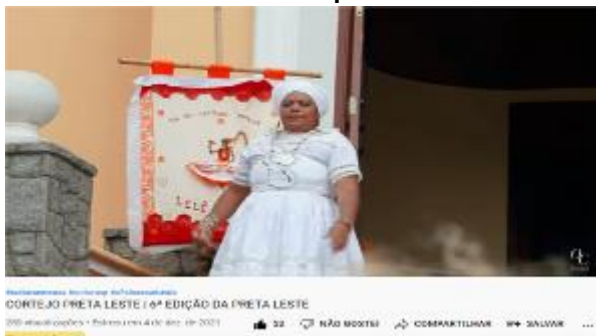
Cortejo Preta Leste