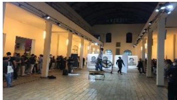
Espectáculo teatral: Cock