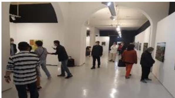
Exposição "Todos juntos"- artistas coreanos