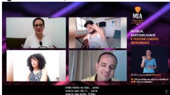
Música, acessibilidade e as possibilidades sensoriais