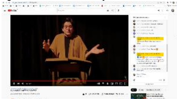
Aula Recital: Do Amor de Dante por Beatriz