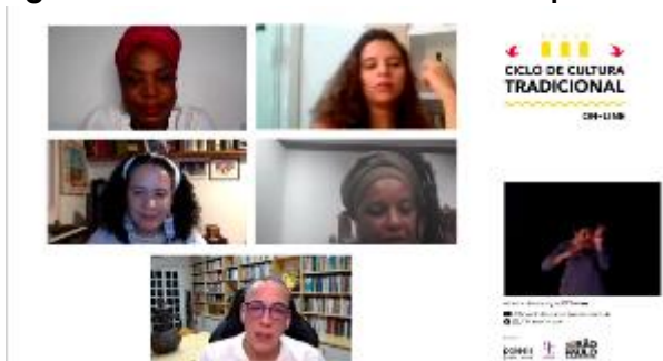
Exibição do filme "De mais longe já viemos" seguida de bate-papo