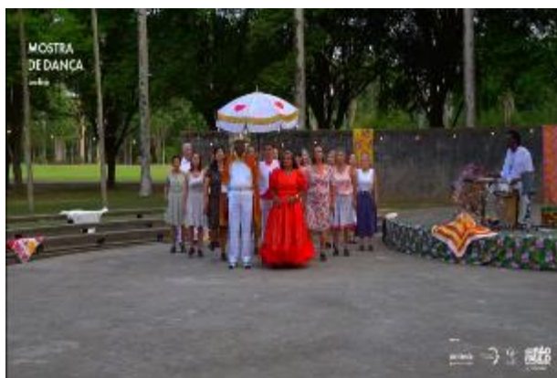
Borogodó, Tap da Longevidade 23/10 | Mostra de Dança