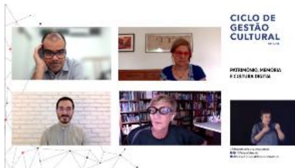
Webinar | Patrimônio, memória e cultura digital