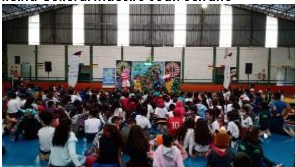
Espectáculo musical "transform-ação" - distribuição de 400 livretos grátis!