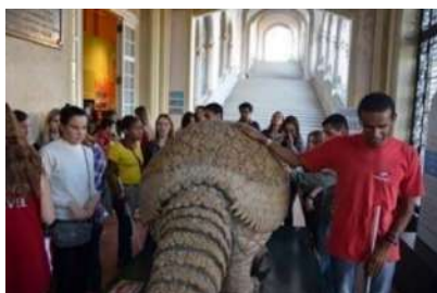
Figura 1- Grupo de deficientes visuais atendidos pelo programa

Abaixo, a síntese das metas repactuadas: