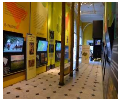
BORBOLETÁRIO Reformulação Seção BIOMAS