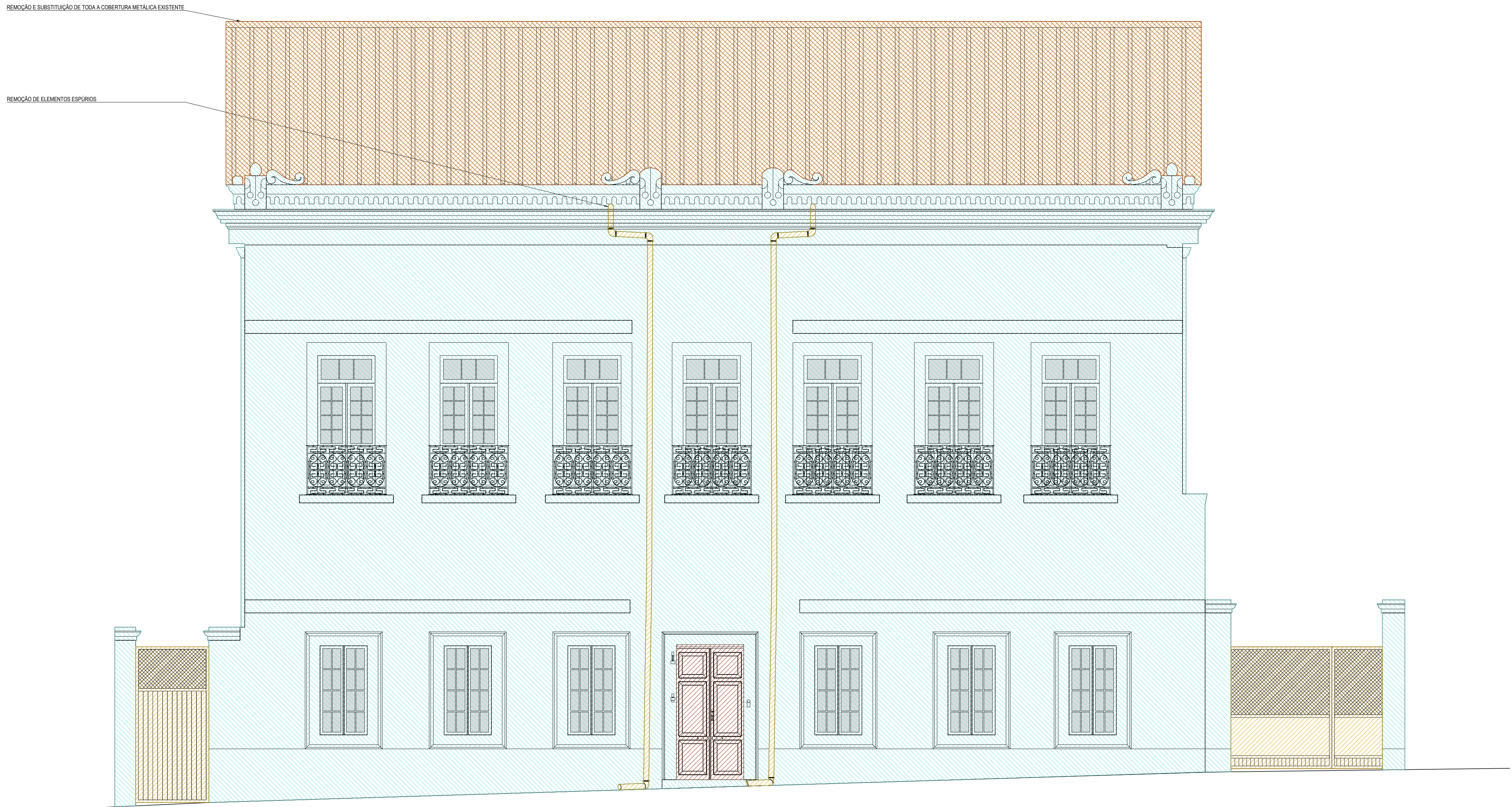
CONSTRUIR, DEMOLIR E RESTAURAR FACHADA NOROESTE 1/50