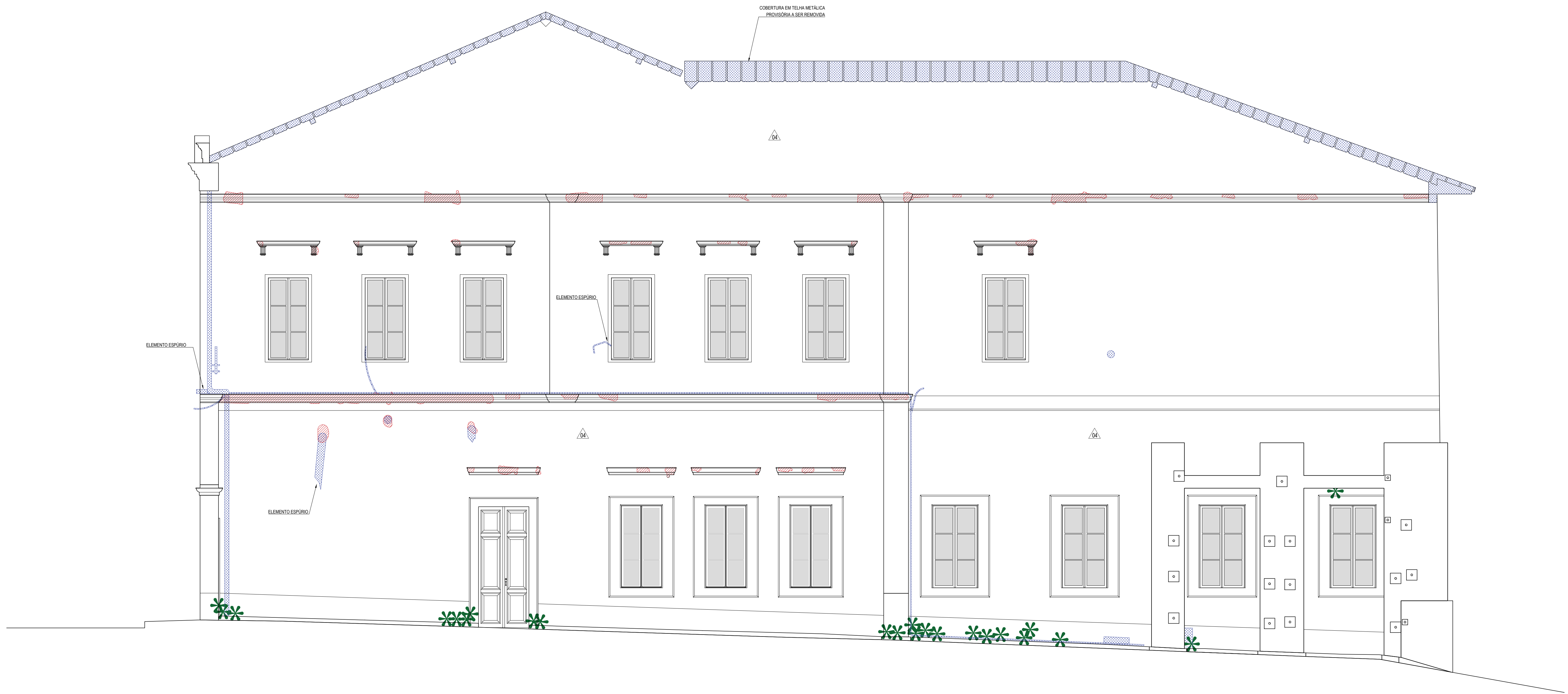
MAPEAMENTO DE DANOS FACHADA SUDOESTE 1/50