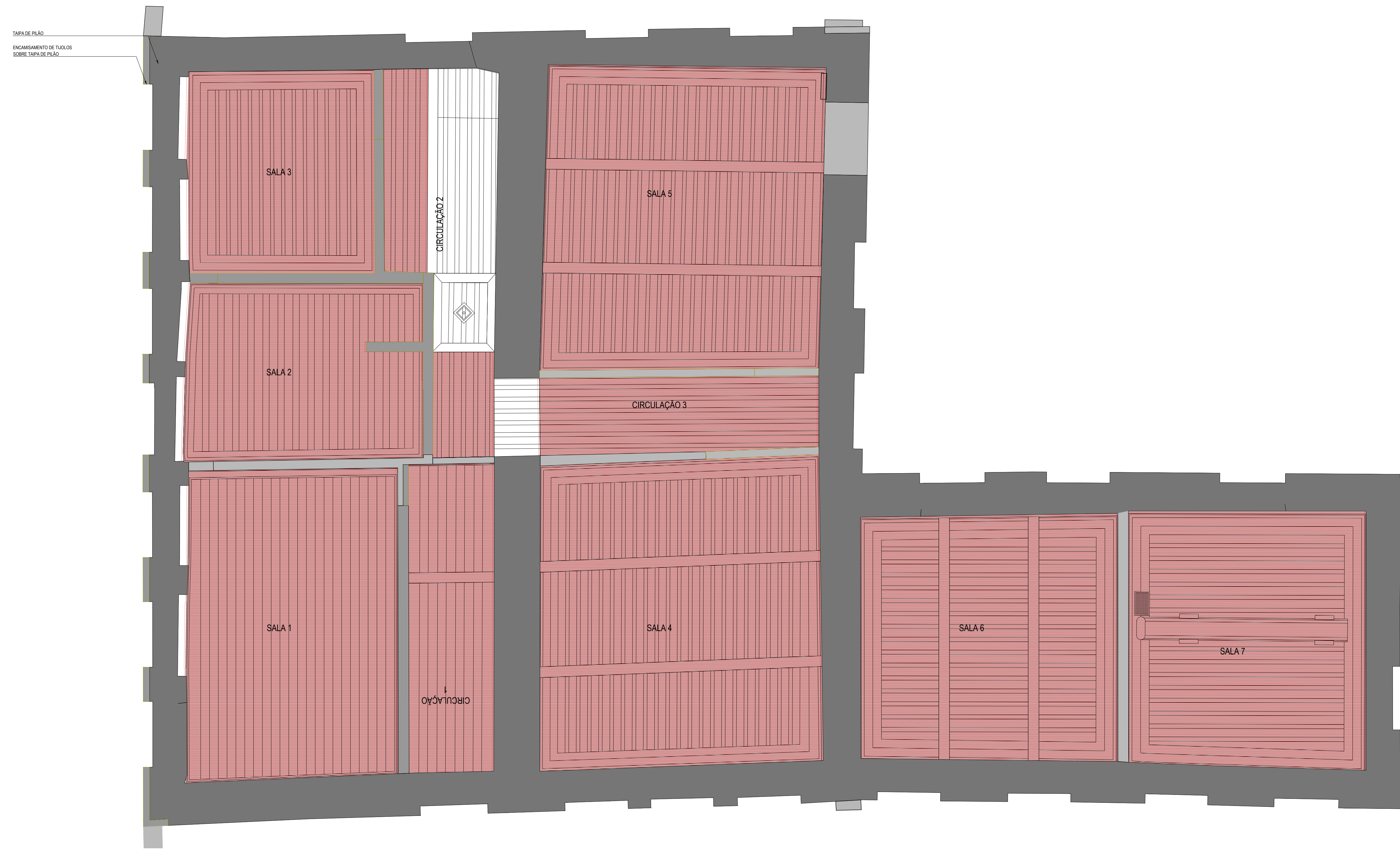
MAPEAMENTO DE DANOS PLANTA DE FORRO | TÉRREO 1/50