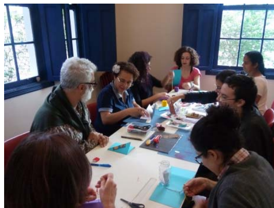
Curso para professores, 27/10