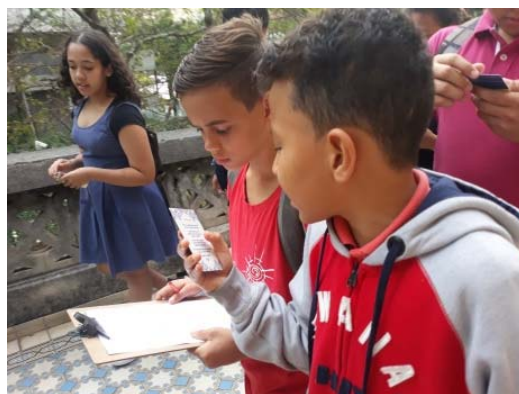
Jogo de mapa na mão e o tempo na cabeça, 6/12