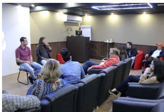
Debate durante Mostra Futuro do C. Brasileiro