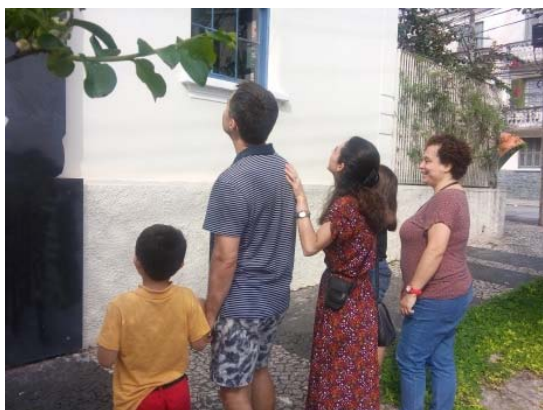
Dia das Crianças, 12/10