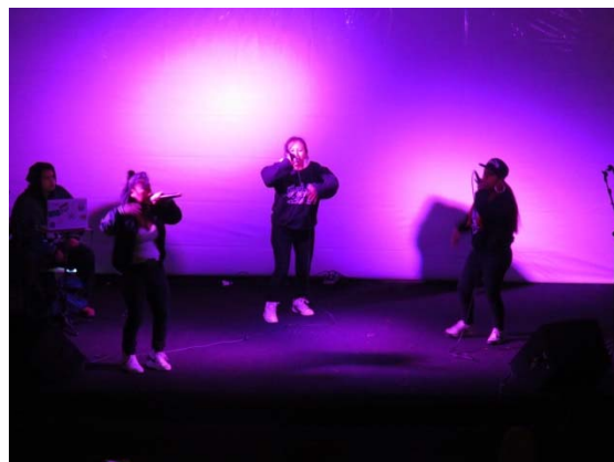
Apresentação do Grupo Apolo de Danças Gregas (esquerda) e do grupo de rap boliviano Santa Mala (direita), durante a Virada da Poesia de 2018, cujo tema foi a questão das diásporas modernas