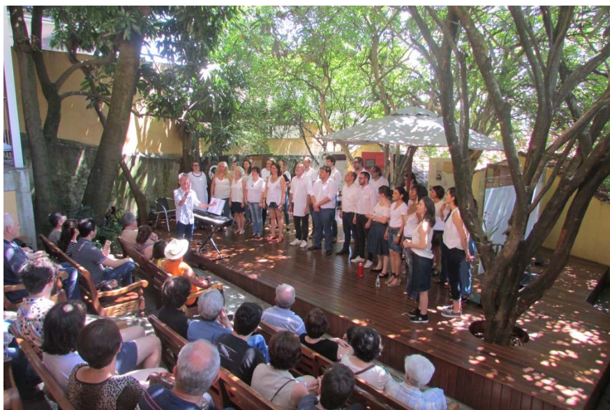
Apresentação do projeto "Canta a poesia", do Coral da Casa das Rosas, na Casa Guilherme de Almeida