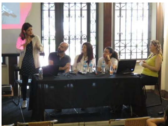
Colóquio Libras Literária, 1/12