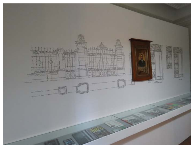
Exposição "Arquiteturas da Memória", tratando a história da Casa das Rosas