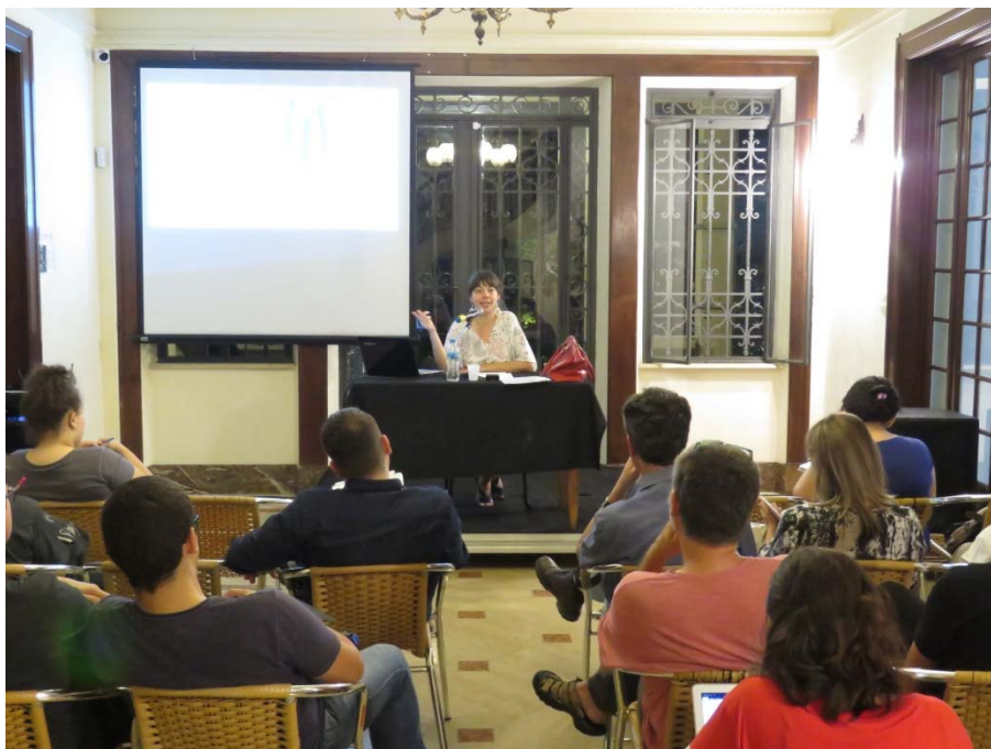
Palestra "Oswald de Andrade, Flávio de Carvalho: amigos, antropófagos", ministrada por Verônica Stigger, dentro do programa Devorando Oswald