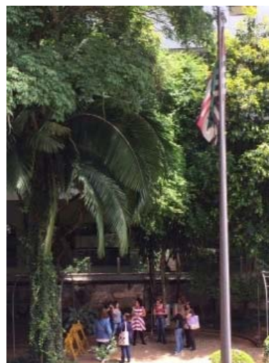
Visita educativa – EE Rodrigues Alves, 9/10