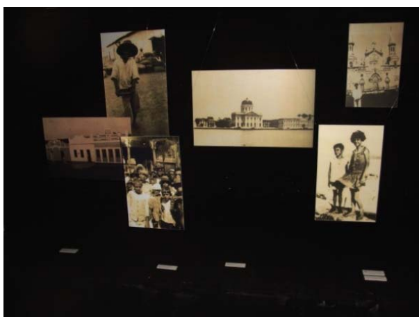
Imagem 4. Exposição Mário Fotógrafo , no porão da Casa Mário de Andrade.