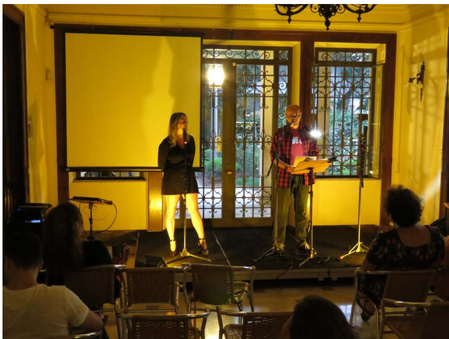
"Sarau para Oswald", evento integrante do programa Devorando Oswald