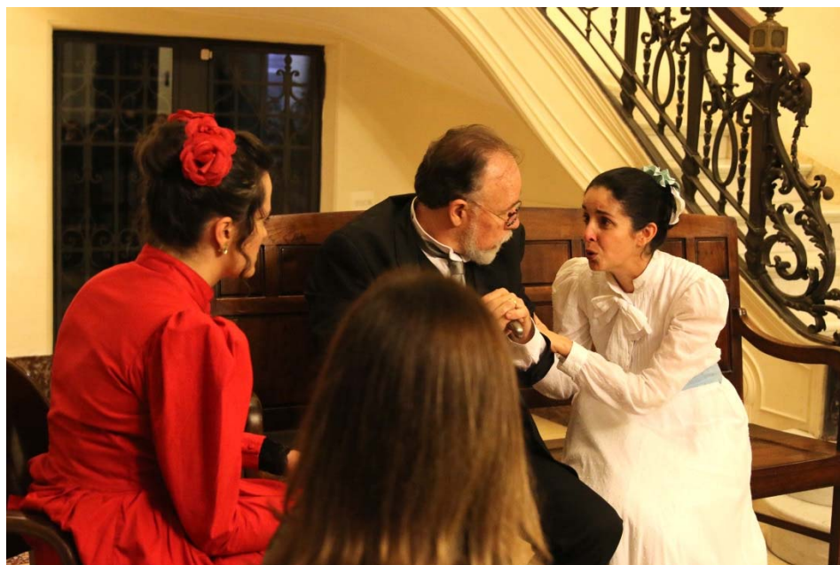
"Tio Ivan", adaptação da peça do escritor russo Anton Tchekov, pelo Núcleo Teatro de Imersão