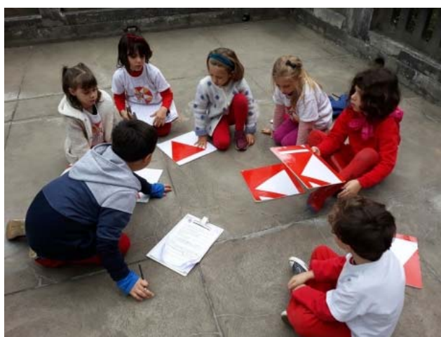
Jogo Viva Vaia, 14/8