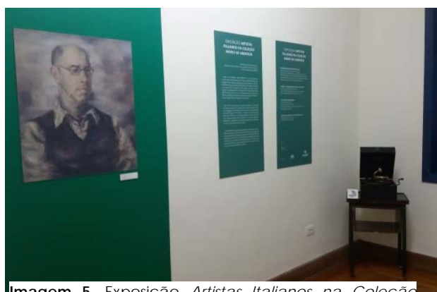
Imagem 5. Exposição Artistas Italianos na Coleção Mário de Andrade , no primeiro andar da Casa Mário de Andrade.