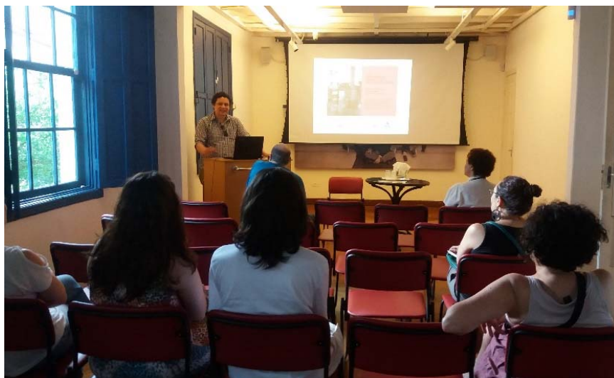
Imagem 17. Palestra Instrumentos e objetos de culto recolhidos pela Missão . Atividade integrante da Campanha Sonhar o Mundo .