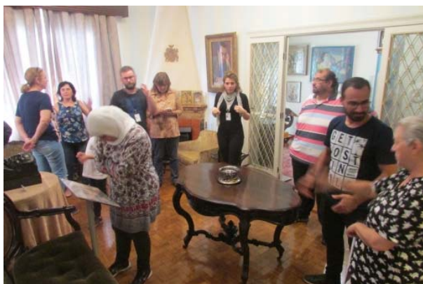
Ação de acessibilidade Cáritas Arquidiocesana de SP, 28/11