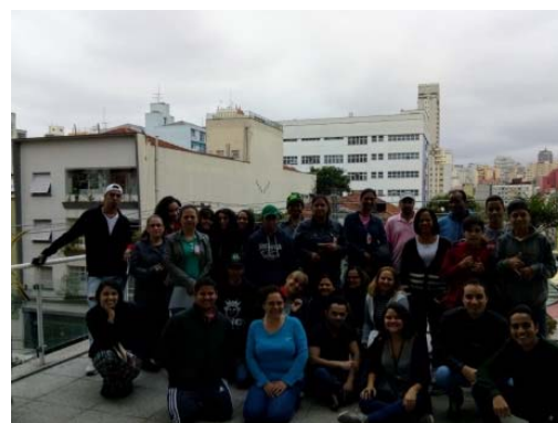
Extramuros Siemaco (EJA), 6/10