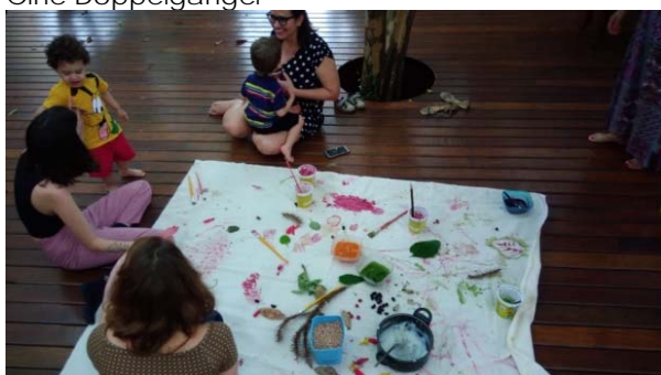
Oficina As cores do quintal, 13/10