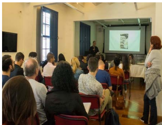
Imagem 14. Curso Cartografando Mário de Andrade: nas fronteiras entre literatura e cidade .