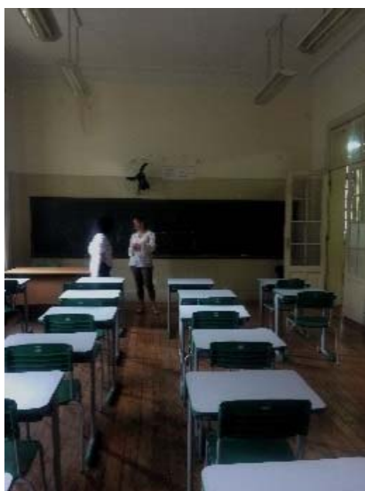
Visita técnica à EE Rodrigues Alves, 19/10