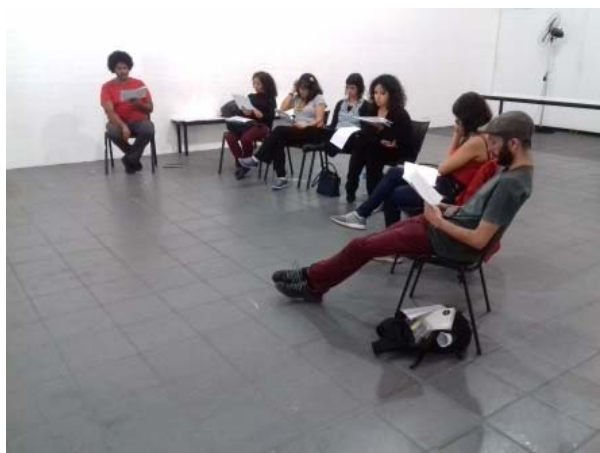
Imagem 18. Grupo de estudos Ritmos Brasileiros: a prática e a teoria das músicas recolhidas na Missão de Pesquisas Folclóricas .