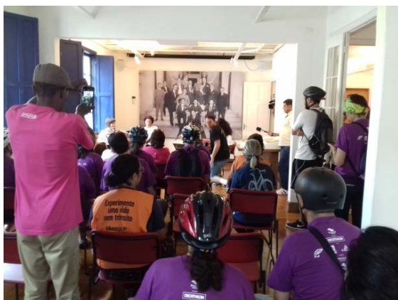
Imagem 1. Evento Ciclovía Musical , em que os participantes puderam assistir duas apresentações musicais na Casa.