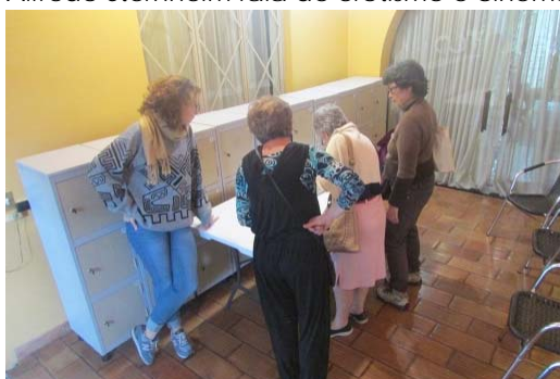
Feira de troca de Livros, 10/11