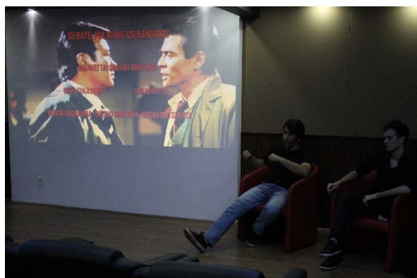
Sessão Versátil +, Yakusa no cinema