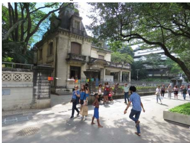
Atividade de férias: Se essa rua fosse minha, 6/12