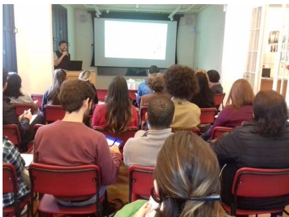
Imagem 13. Curso Cartografando Mário de Andrade: nas fronteiras entre literatura e cidade .