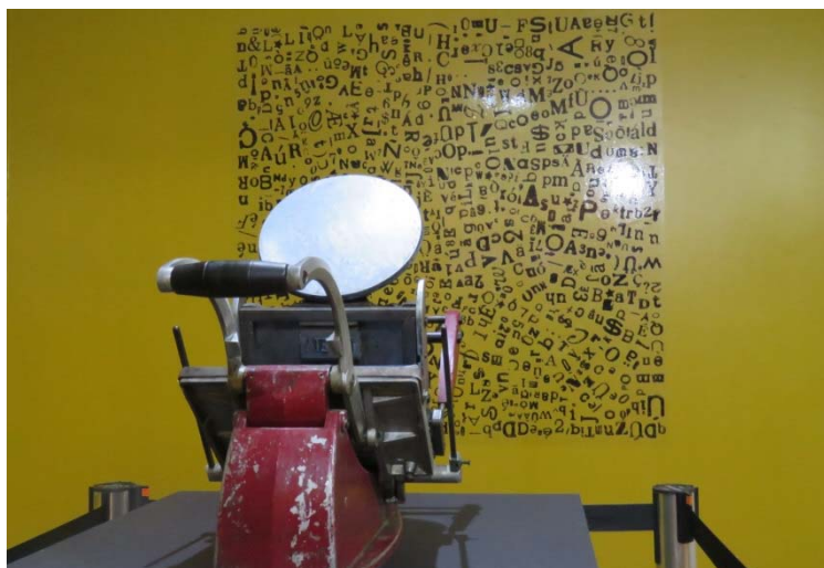
Exposição "Typoeta: Guilherme Mansur", em homenagem ao tipógrafo e escritor mineiro que contribuiu com a obra de Haroldo de Campos em diversos momentos