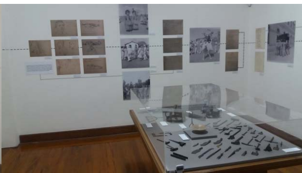
Imagem 7. Exposição Mário de Andrade: uma missão de vida ou morte - 80 anos da Missão de Pesquisas Folclóricas .