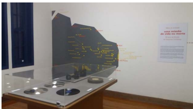
Imagem 6. Exposição Mário de Andrade: uma missão de vida ou morte - 80 anos da Missão de Pesquisas Folclóricas .