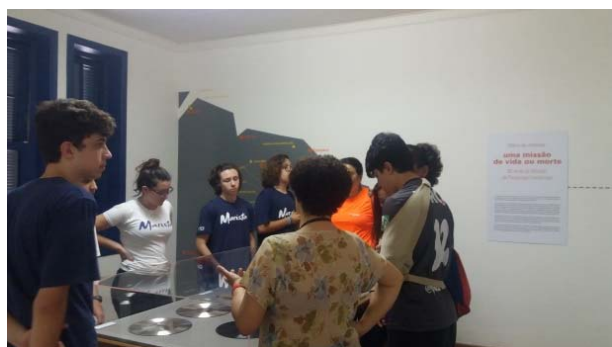
Visita educativa Colégio Marista, 3/10