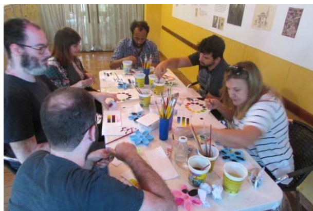
Curso Pensar as cores, 1/12