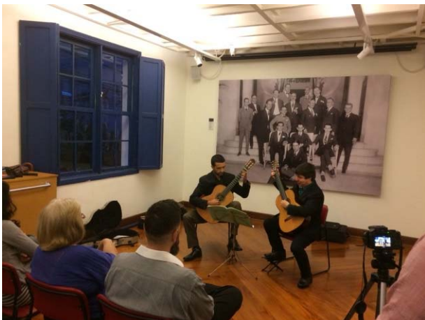
Imagem 11. Lançamento do livro Francisco Mignone - cinco peças para dois violões , da Editora Tipografia Musical.