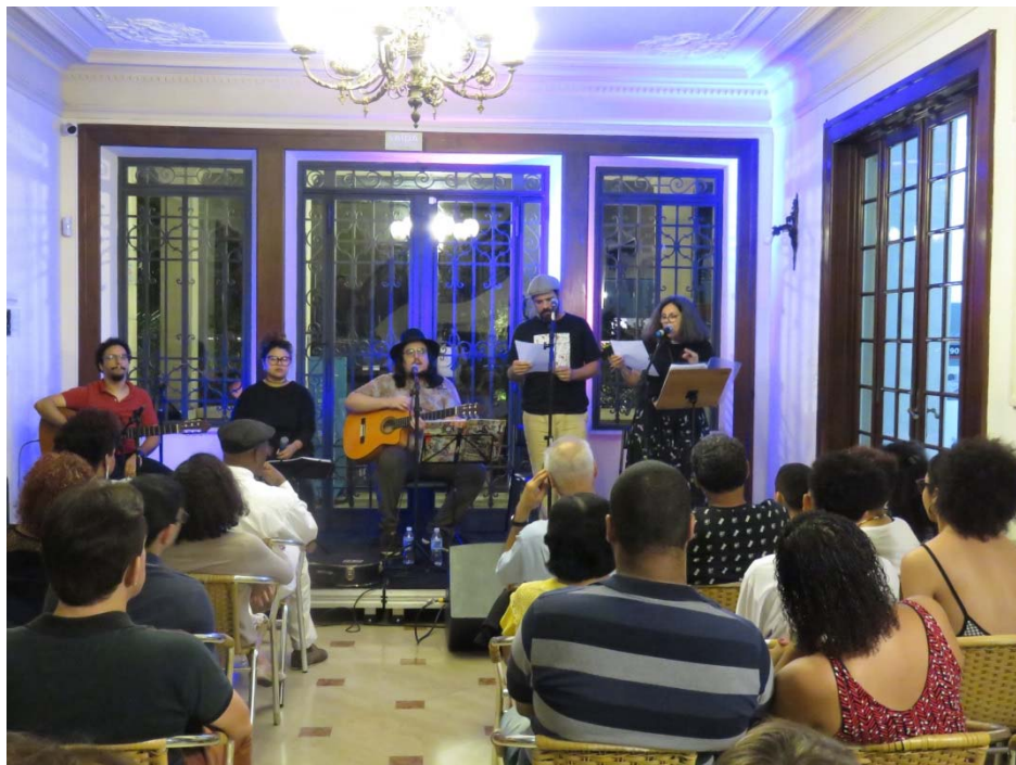
Apresentação literomusical "Os Três Andrades", dentro da programação Devorando Oswald, em parceria com a Oficina Cultural Oswald de Andrade