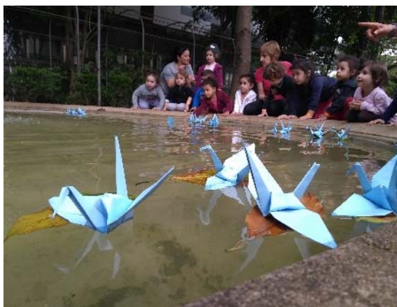
Visita educativa – CEI Treze de Maio, 4/10