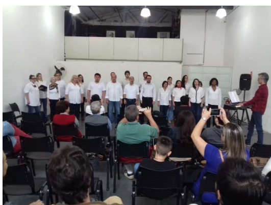
Imagem 15. Coral da Casa das Rosas em apresentação no galpão da Casa Mário de Andrade.