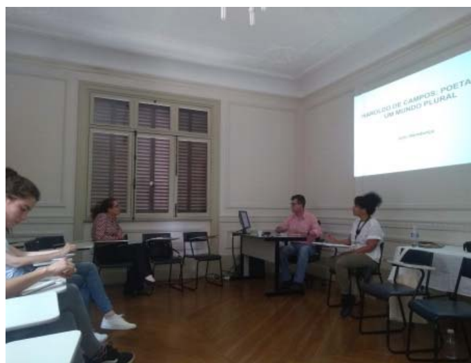
Curso para professores, 28/11