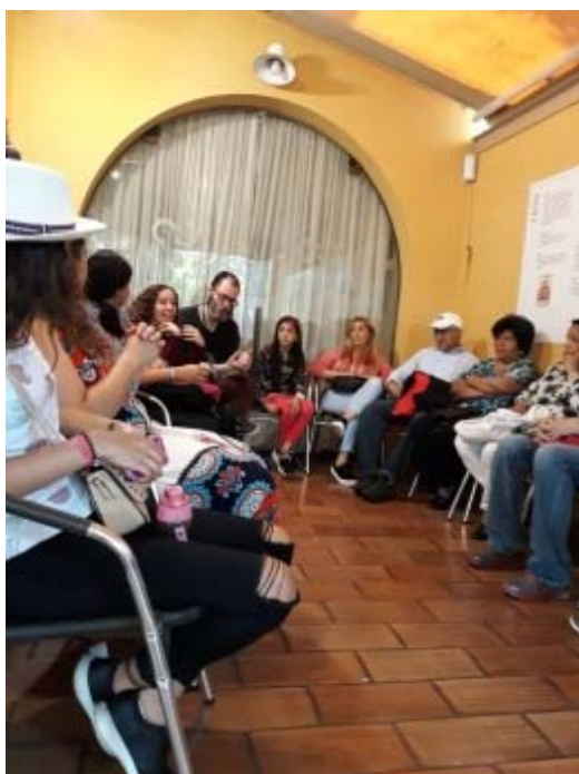
Oficina para Casa Mafalda, 24/11