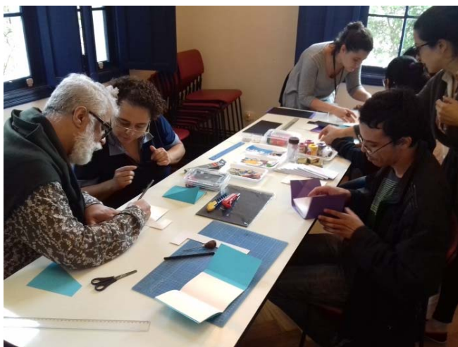
Imagem 3. Formação de professores e educadores Inventário dos Sentidos .