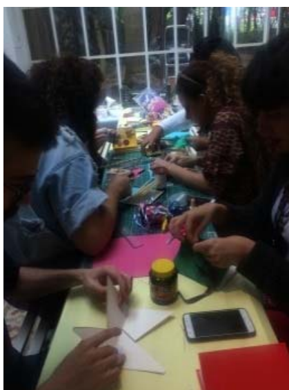
Livro ilustrado de memórias, 9/11