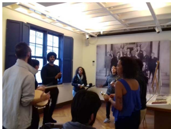
Imagem 19. Grupo de estudos Ritmos Brasileiros: a prática e a teoria das músicas recolhidas na Missão de Pesquisas Folclóricas . Nesta aula, alunos praticam o ritmo caboclinhos, recolhido na Missão e estudado por Mário de Andrade.