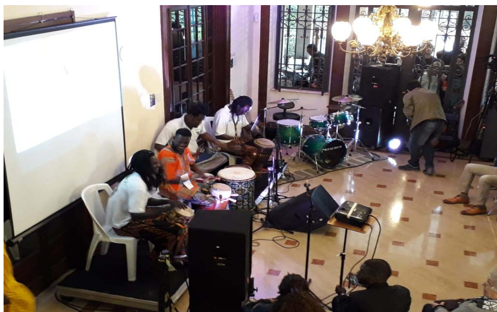
Apresentação de percussionistas durante o evento do Dia da Consciência Negra, "Sunu thioSSane: nossas tradições"