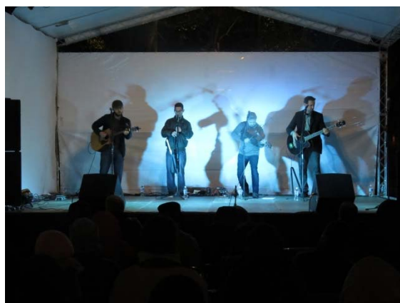
Apresentação da Tunas Celtic Band, com participação do grupo de dança irlandesa Illegrya, durante a 31ª comemoração do Bloomsday em São Paulo, que completou 30 anos em 2018