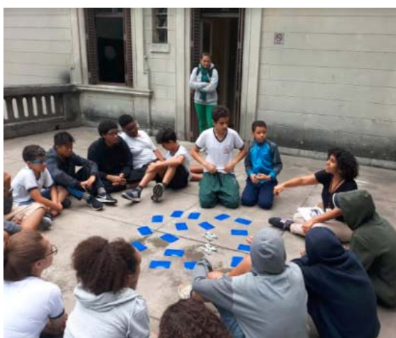
Jogo da memória, 4/10