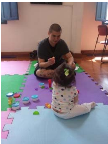
Oficina Instrumentos Musicais, 24/11