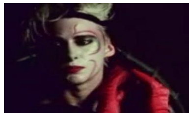
Filme exibido no CineMIS