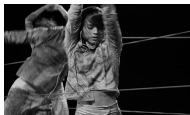
SP Cia de Dança