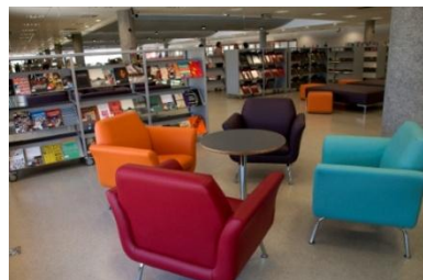
Biblioteca São Paulo