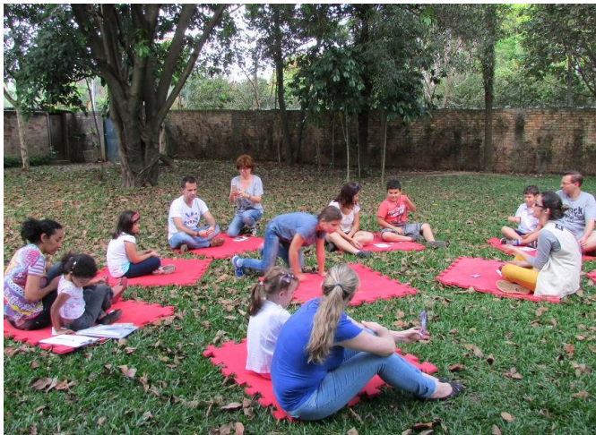
Participantes da oficina organizam-se para começar a brincadeira