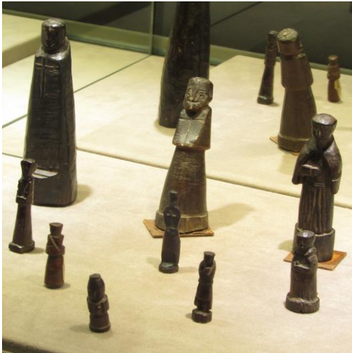
Acervo de imagens de nó de pinho, exposto para celebração do dia da Consciência Negra