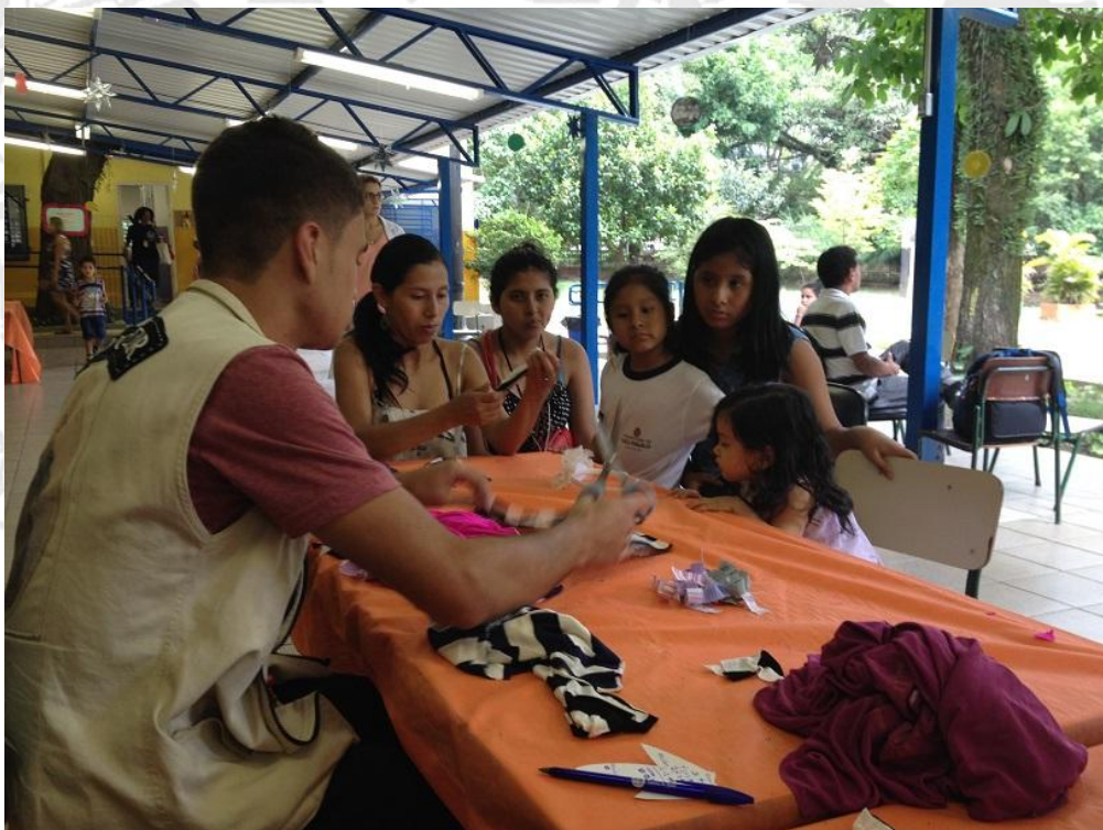
Famílias participam da oficina de boneca Abayomi realizada na EMEI João Theodoro

Meta 15 – Desenvolver ações pontuais para atualização do espaço expositivo de longa duração: Com a necessidade de uma reformulação no espaço expositivo para receber a exposição em parceria com o Palácio do Estado a exposição "Rememoração: arte religiosa como documento histórico", o Setor Técnico realizou ações durante o 3º e 4º Trimestre, emitindo um relatório para cada um, superando a meta prevista para o exercício. Esta superação não onerou o orçamento nem tão pouco prejudicou a realização das demais metas, e sim proporcionou uma visão mais clara das ações realizadas para reorganizar e revigorar o espaço expositivo do Museu.