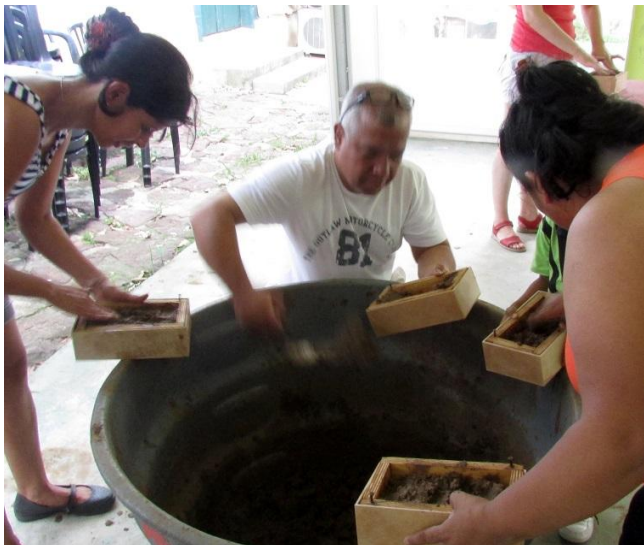
Participantes adicionam a mistura de barro, água e areia à forma de madeira, base para criação do bloco de adobe