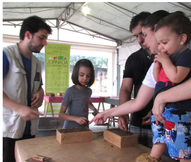
Garota recebe orientações da família e educador do Museu sobre como desformar o tijolo produzido