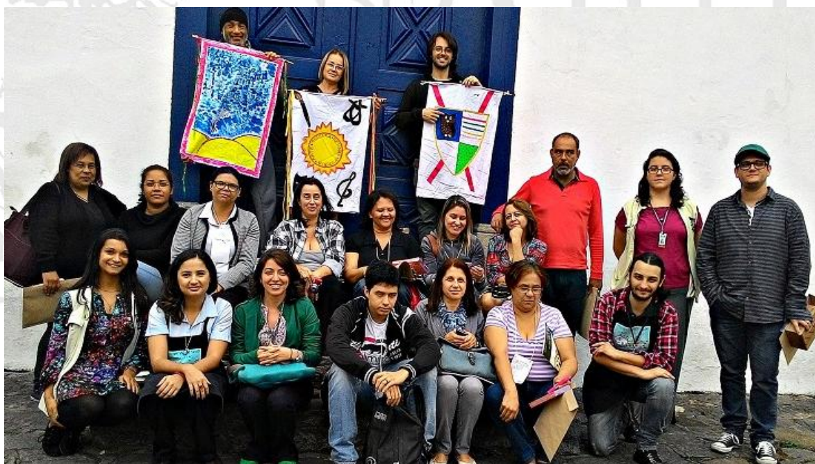
Professores posam com os estandartes confeccionados no Museu de Arte Sacra dos Jesuítas em Embu

Meta 26 - Realizar programa Interessante e Interativo (Férias no Museu e datas comemorativas e feriados): Foram realizadas quatro atividades enquanto parte do Programa Interessante e Interativo, a saber: “Descobertas no Jardim: Cinco Marias”, “Consciência Negra: Oficina de bonecas Abayomi”, “1ª Jornada do Patrimônio: Oficina de Tijolo de Adobe” e “Especial de Natal: Oficina de cartões postais”.