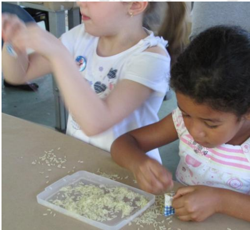
Meninas confeccionam suas "Marias"