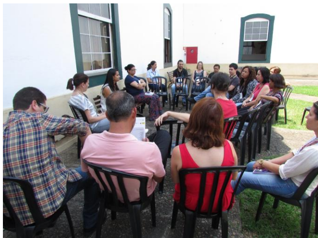
Roda de conversa promovida no Museu de Arte Sacra de São Paulo

a construção dos sujeitos nos acervos”, em conjunto com a Pinacoteca do Estado de São Paulo. A visita em parceria com o MASJ ocorreu em dois sábados, 17 e 24 de outubro, dada a distância geográfica das instituições parceiras e teve duração de 14 horas. Por sua vez a ação em conjunto com a Pinacoteca ocorreu no domingo 8/11 e pela primeira vez teve sua carga ampliada para sete horas a fim de propiciar um diálogo mais efetivo entre educadores e professores na hora adicionada.