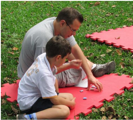
Pai e filho jogam "Cinco Marias" no novo Jardim do MAS

No mês de outubro em que é celebrado o dia das crianças propusemos ao público a (re)descoberta de uma brincadeira tradicional, o jogo "Cinco Marias" que tem sua origem no período greco-romano e, que apropriado pelos portugueses difundiu-se pelo Brasil com este nome que remete a tradição cristã. Os participantes puderam conhecer algumas das representações de Maria no acervo e por fim conhecer o novo jardim do Mosteiro, recém-aberto ao público, local ideal para a produção dos pesos feitos de tecido e arroz, peças com as quais se pratica a brincadeira. A ideia foi propiciar a interação entre adultos e crianças a partir de uma brincadeira tradicional que envolve habilidades manuais seja para a confecção das peças como para a prática do jogo. Participaram da oficina 60 pessoas, entre as quais um grupo de escoteiros. As oficinas gratuitas ocorreram nos últimos quatro sábados do mês de outubro, sempre às 15h.