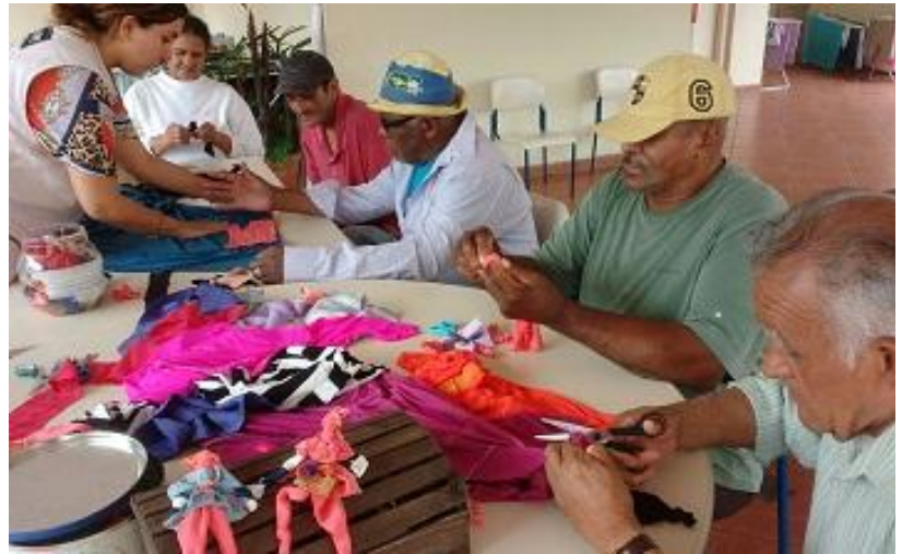
Adultos participam da oficina de boneca Abayomi durante o Dia da Família na Escola