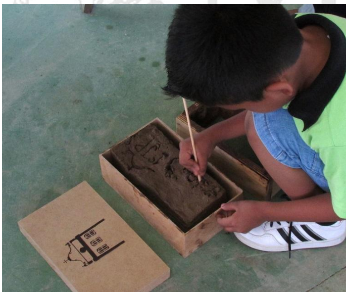
Criança customiza o tijolinho de adobe, já colocado na caixa de mdf que permite levá-lo como recordação da 1ª Jornada do Patrimônio