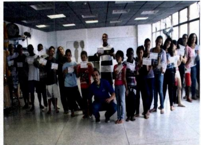
Cursos de Férias: Tecidos Aéreos - Fábrica de Cultura Vila Curuçá e Cantos e Instrumentos de Capoeira - Fábrica de Cultura Cidade Tiradentes