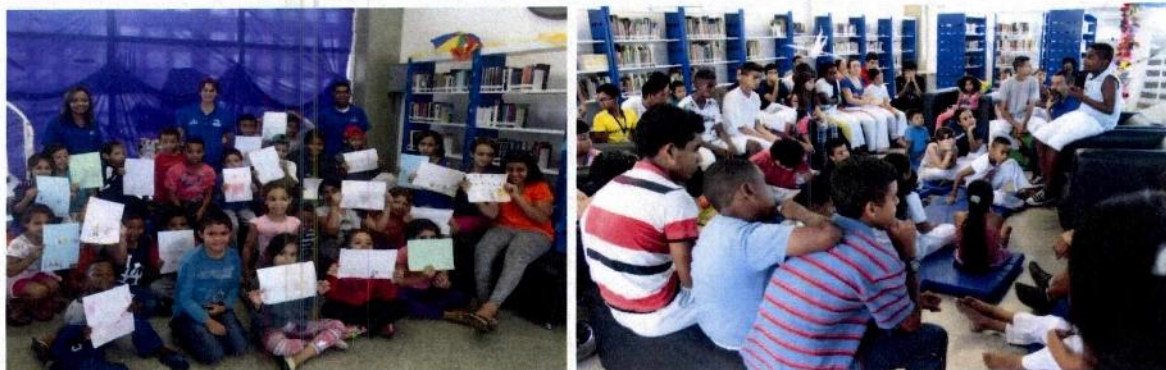
Contação de História - CFC Sapopemba e Encontro com o Autor - CFC Itaim Paulista

(*) Encontro de leitores e autores; Encontro de leitores, Contação de histórias; Saraus; Atividades Temáticas; Oficinas; Interface com ateliês de criação, trilhas de produção e projeto espetáculo; Intervenções artístico-literárias; Rodas de leitura; Leituras públicas; exibição de filmes, entre outras ações