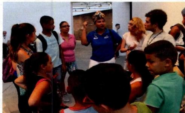
Ateliê de Balé - CFC Cidade Tiradentes e Saída Pedagógica para a Exposição Aqui África no Sesc Belenzinho - CFC Sapopemba