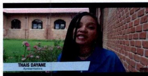
TV Fábricas 201ª Edição - Resumo 27 a 31/01/16 e Atrações de 04 a 07/02/16!