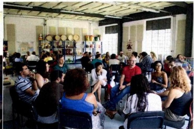
Workshop entre educadores - Diálogos com a Lente e Formação por Fábrica - Equipe de Sapopemba