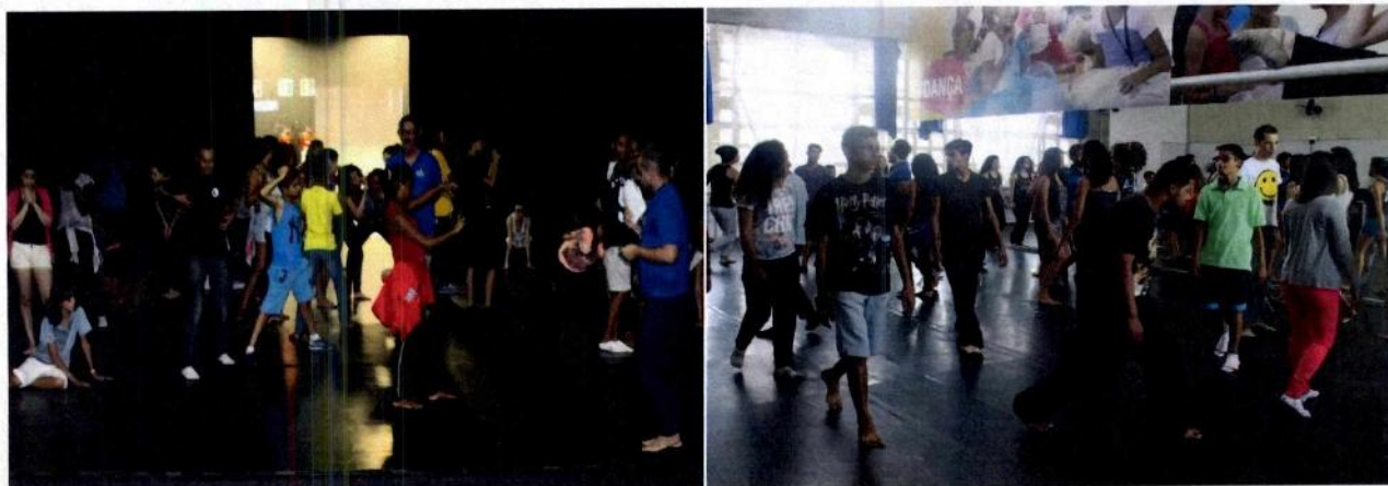
Aprendizes em atividade - Fábricas de Cultura Cidade Tiradentes e Itaim Paulista