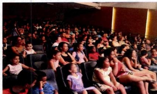
Espectáculo "As Aventuras de Gibiló e Gibileu da Cia Estrípulas Imagináveis - CFC Itaim Paulista