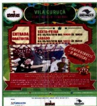
Cartaz de divulgação Espetáculos- 05 e 06/02/16