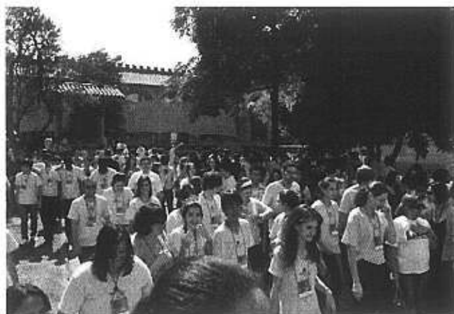
2ª MOP em 2012