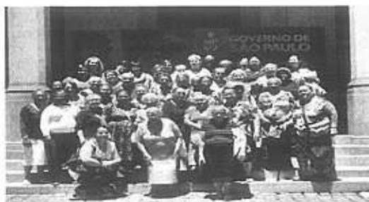
Grupos de crianças indígenas e de visitantes da terceira idade, atendidos no rotelro Catavento Acessível