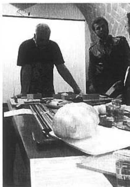
Cartaz de divulgação e registro de Oficinas Técnicas realizadas no Catavento em 2012