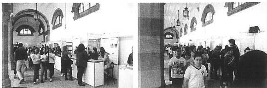
1ª Edição da MOP Ciências em 2011