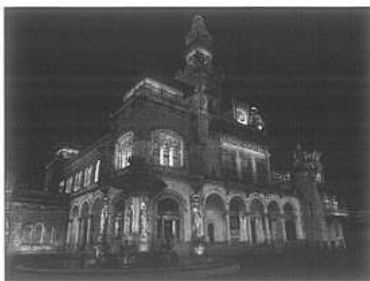
Projeto Luminotécnico para o Palácio das Indústrias